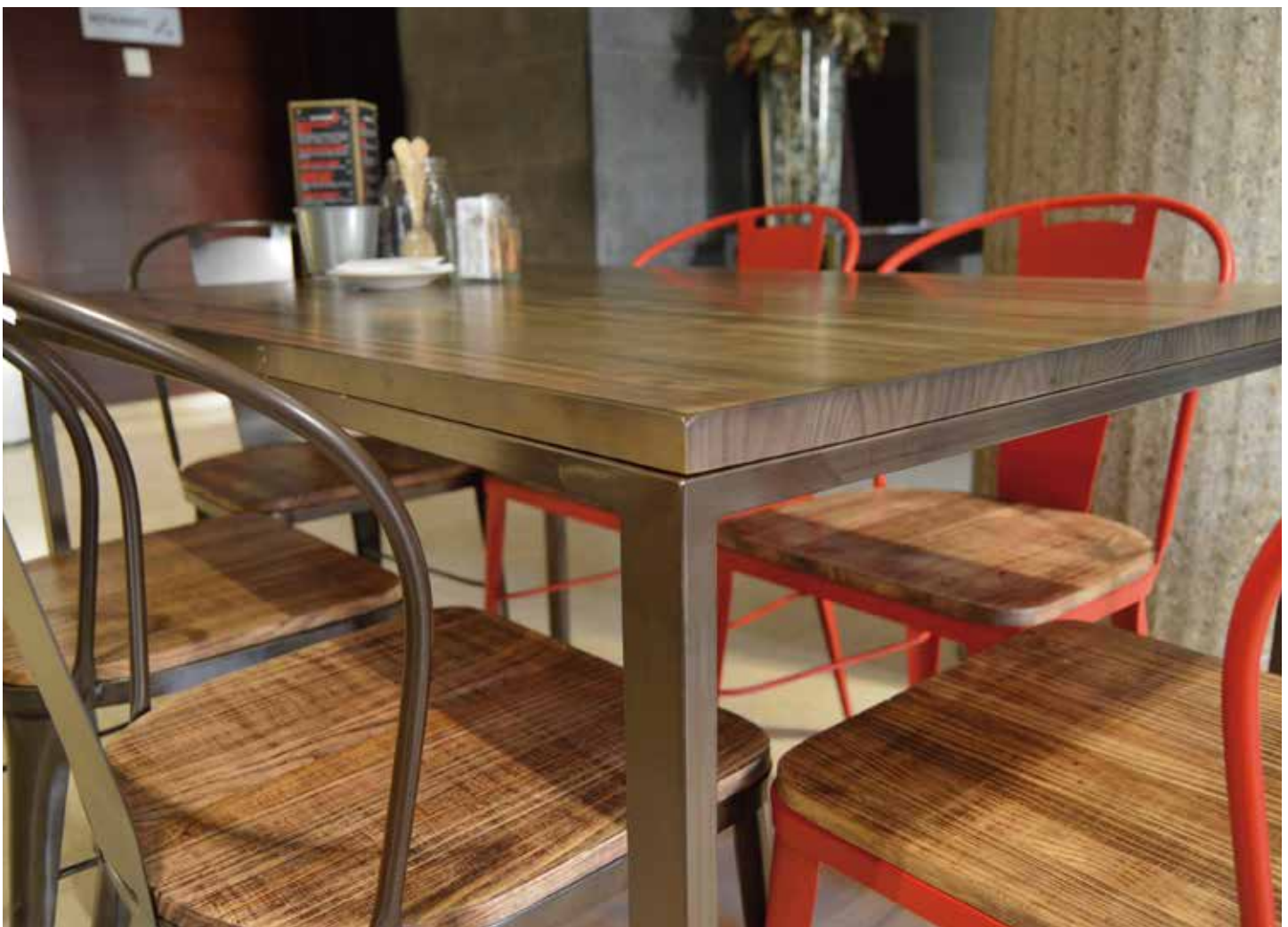
Hotel ZENIT DON YO, Zaragoza