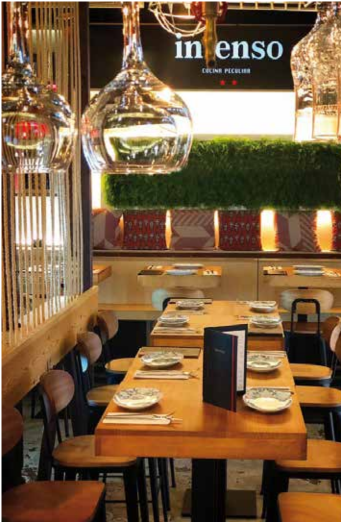
Café INTESO, A Coruña