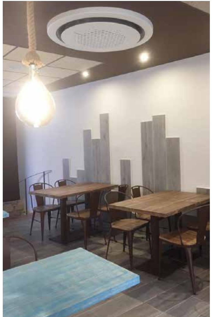
Hotel MARS, Benabarre. Huesca